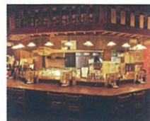
※料理写真はイメージです