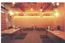
※料理写真はイメージです

当店の売り! 炭火焼き鶏串を含む 自慢の品々! 俺たちの炙り家でしか 味わえない満足! 満腹!