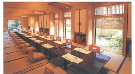
※料理写真はイメージです