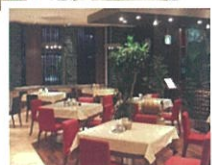
※料理写真はイメージです