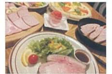
※料理写真はイメージです