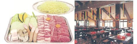
※料理写真はイメージです