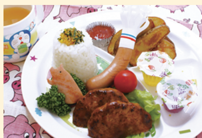
「お子様ランチ」ジュース付 780円