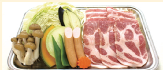
「グルメBBQセット」通常 2,200 円のところ 豚肉 125g・ウインナー 野菜各種・焼そば又はライス 1,980円 (特別価格)