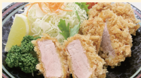
「ヒレカツセット」 スープ・ライス又はパン 1,580円 (特別価格) 通常 1,750 円のところ