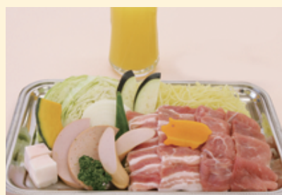
「お子様BBQ」ジュース付 1,200円