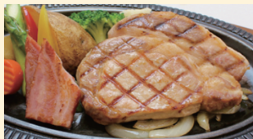
「ポークステーキセット」 スープ・ライス又はパン 1,700円 (特別価格) 通常 1,880 円のところ