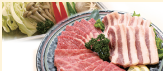
「バラエティーセット」通常 2,800 円のところ (黒毛和牛カルビ 80g・ 豚バラ肉 50g)計130g 2,600円 (特別価格) 野菜各種